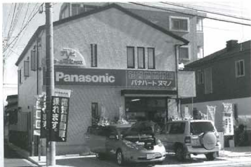
▲日産の電気自動車「リーフ」の試乗会を実施した1期生の沼野電器

もちろん、これはこれで日々の地道な営業活動を通じて行っていかねばいけません。そうしなければ客数は減り、経営は先細りするからです。しかし、自店の400世帯の稼働客が、すぐに800世帯にはなりません。